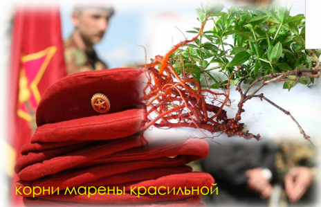
корни марены красильной