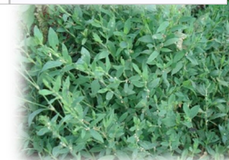
Птичья гречиха (травка-муравка)